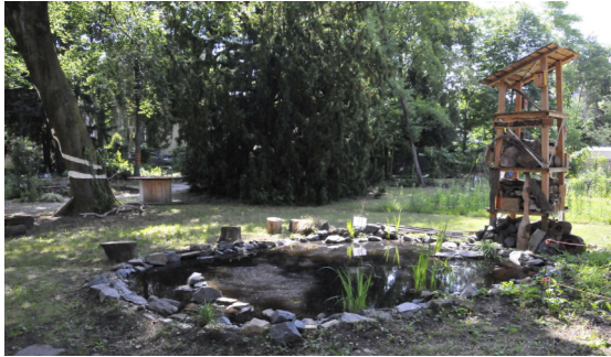
Lern- und Rückzugsort: der Schulgarten der ELO