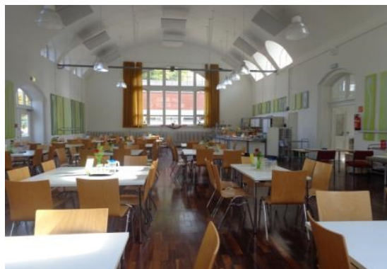
Schulinselmensa vor dem täglichen Ansturm