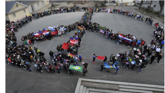
Die ELO im Einsatz für Toleranz und friedliches Miteinander

Unser Status als Selbständige Schule - als einziges Gymnasium in Darmstadt - gibt uns erweiterte Handlungsspielräume in den Bereichen Finanzen und Personalplanung. Für die Sicherstellung eines stets optimierten schulischen Angebots übernehmen wir sehr gerne mehr Verantwortung!